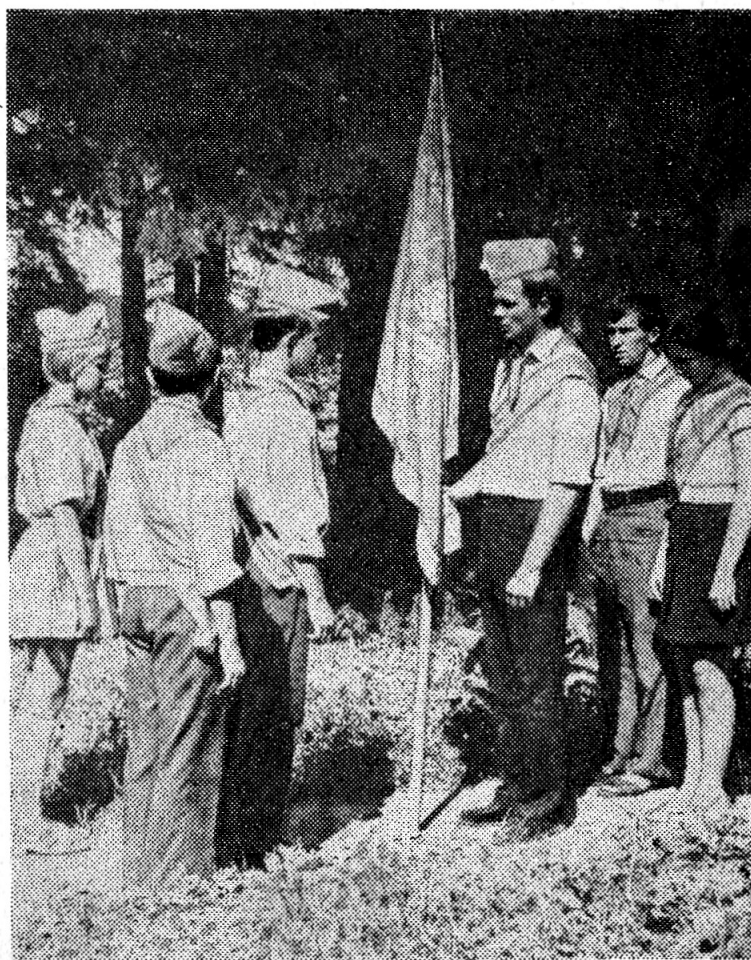
Так начиналась вторая смена. На снимке: знаменная группа вожатых передает дружинное знамя лагеря пионерской знаменной группе.