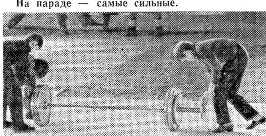
На параде — самые сильные.