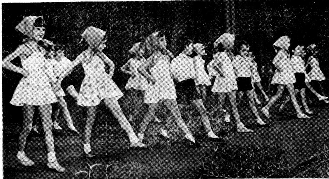
110 детей занимаются в балетной студии Дома культуры ОИЯИ (руководитель И. А. Меркулова). 110 ребят в возрасте от 6 до 16 лет не только постигают азы классического и народного танца — они учатся гармонии, учатся красиво двигаться, любить и понимать музыку.

Цели, которые стоят перед студией, широки и многообразны. Летом 1973 года ее стены покинули первые 10 выпускниц, две из них решили навсегда связать свою жизнь с искусством.