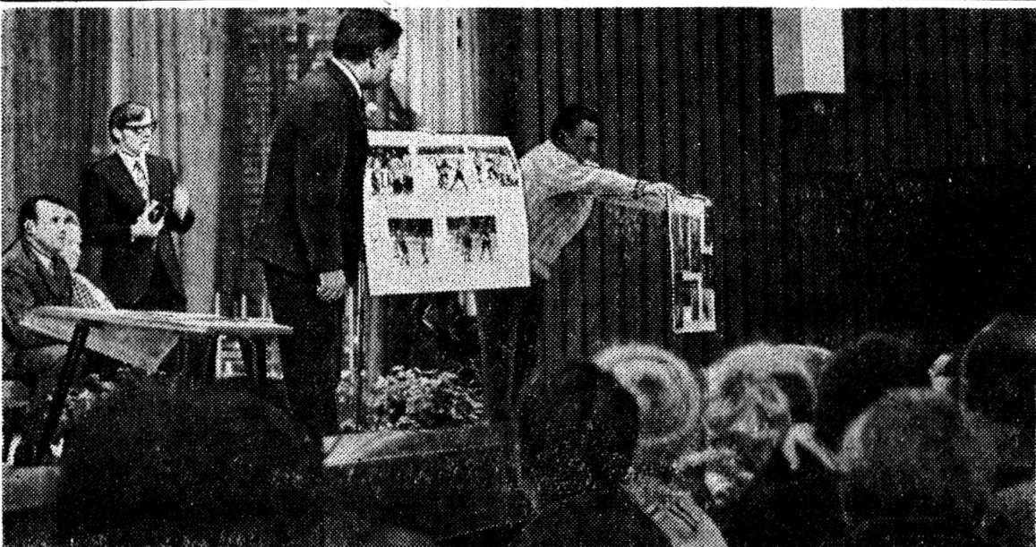
Одной из форм культурно-массовой работы Дома культуры являются встречи с писателями, журналистами. Этот снимок сделан во время встречи с группой фотокорреспондентов ТАСС.