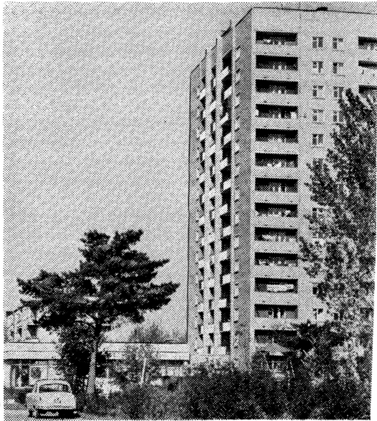
Город наш растет в высоту. На его улицах за последние годы построено несколько высотных зданий. В 14-этажном доме на ул. Векслера открыт книжный магазин.

О чем бы ни шла речь на страницах «Советской России» — об экономике или партийной работе, науке или школе, о культуре или быте, — редакция стремится сделать все, чтобы публикуемые материалы с интересом читались рабочим и колхозником, учителем и врачом, инженером и ученым. Редакция стремится к тому, чтобы каждый номер газеты не был похож на предыдущий, чтобы любой читатель мог найти в номере материал, адресованный только ему.