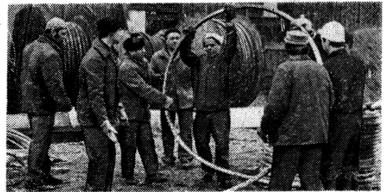
Сотрудники электротехнического отдела на прокладке кабеля.