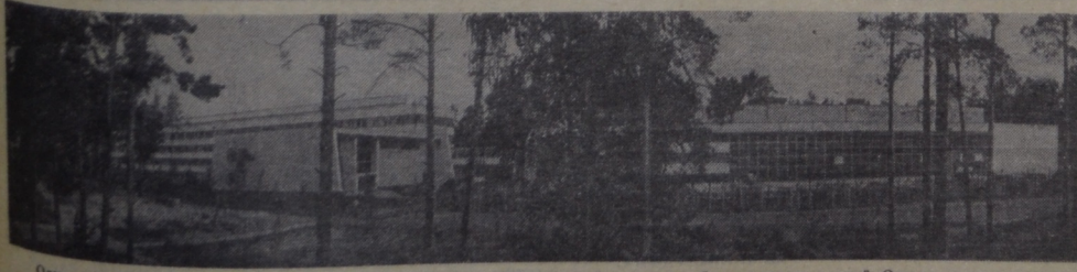
Одним из крупных объектов капитального строительства в девятой пятилетке был комплекс зданий Отдела новых методов Фото Ю. Туманова.

Завершением летней «учебной четверти» педагогов станет традиционный августовский педагогический совет, на котором будут подведены итоги прошедшего 1974—1975 учебного года, поставлены задачи перед коллективами школ города на новый, 1975—1976 учебный год.