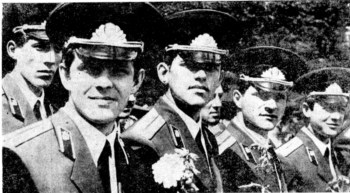
Первый выпуск офицеров в Дубне. 1974 год.

23 февраля — День Советской Армии и Военно-Морского Флота