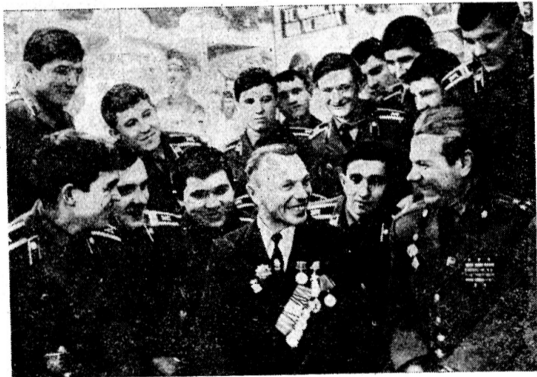
Участники Великой Отечественной войны Герой Советского Союза В. Н. Толстов и полковник Г. Ф. Гребенюк во время встречи.