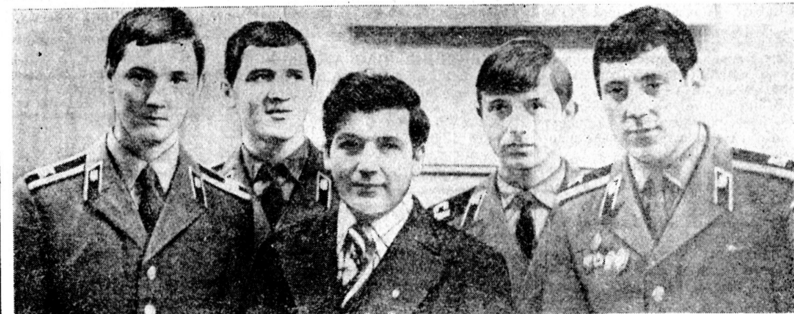
Дважды Герой Советского Союза летчик-космонавт СССР Петр Ильич Климук среди курсантов училища.