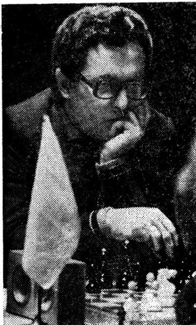
Победитель турнира гроссмейстер В. Цешковский.