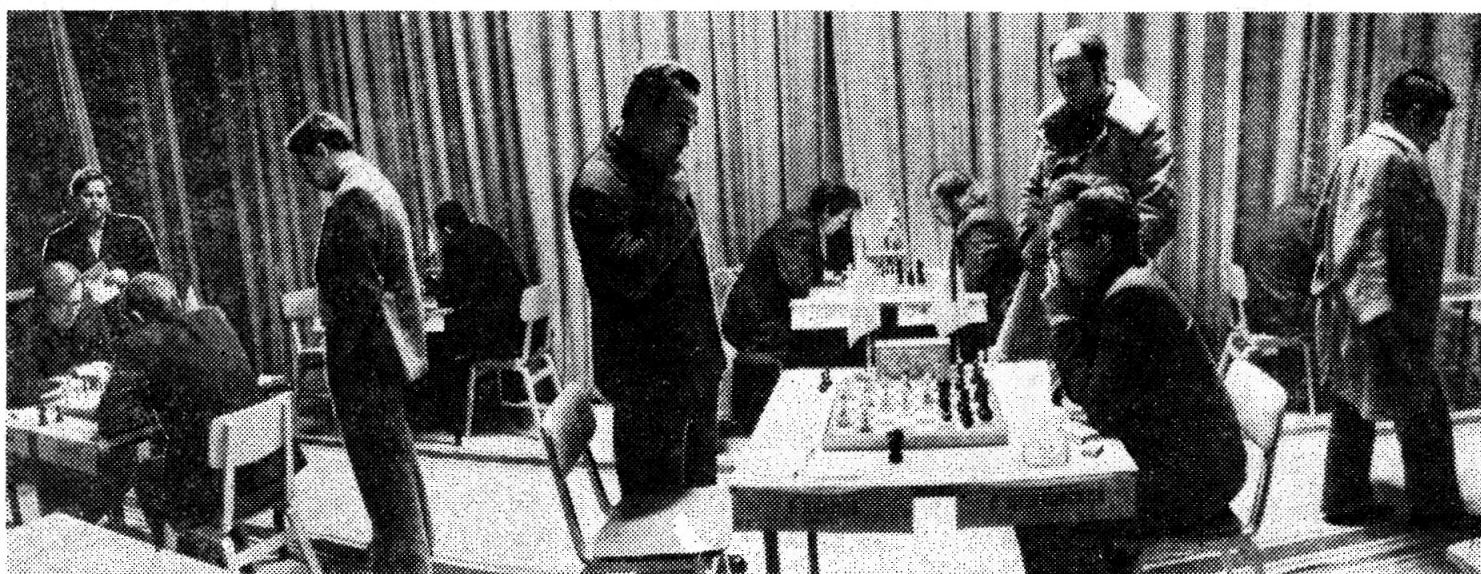
Без малого три недели продолжался турнир «Дубна-76». В каждом туре шла острая бескомпромиссная борьба. В зале всегда было много любителей шахмат. На снимке: идет очередная тур.