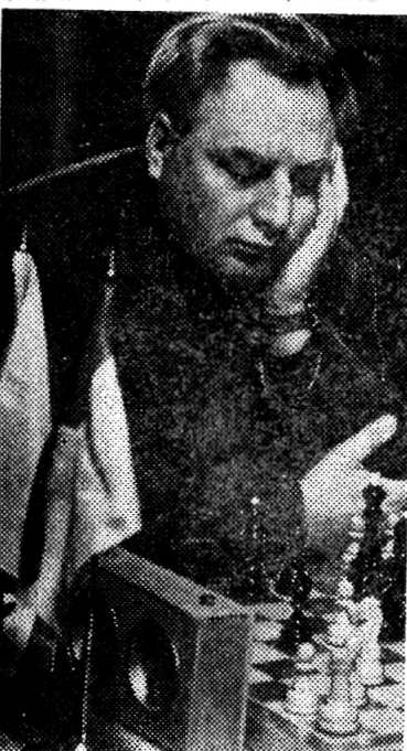
Гроссмейстер А. Суэтин