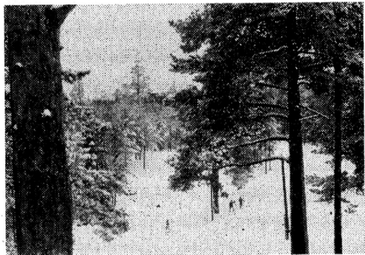
Весна все настойчивее стучится в дверь. Но зима пока не сдает своих позиций — ночью держатся морозы. Такая погода благоприятствует любителям лыжного спорта. Многие из них ранним утром спешат в лес, чтобы пройти по белоснежной лыжне, послушать весенний птичий хор.