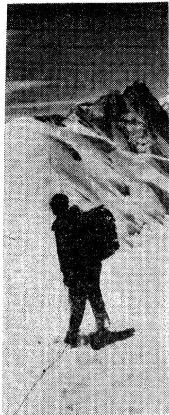
В сердце Тянь-Шаня. Хребет Терской-Алатау.