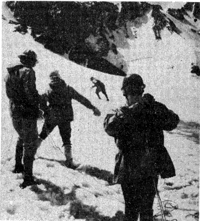
На пути к очередному перевалу. На Каракольском леднике.