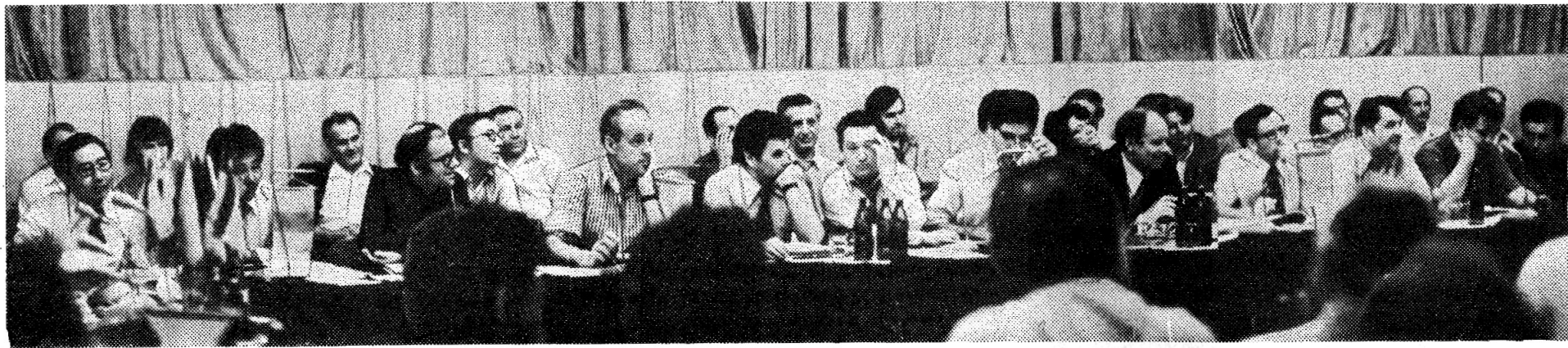
Идет заседание 42-й сессии Ученого совета ОИЯИ