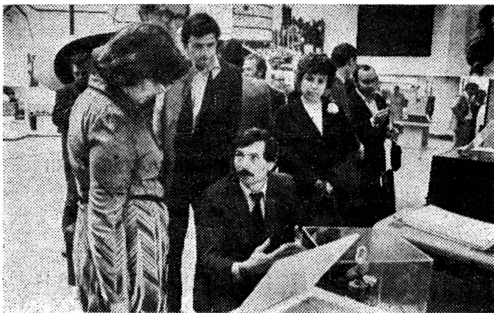
На снимке: автономная система управления гониометром НГ-3 на выставке «Мирный атом в странах социализма».