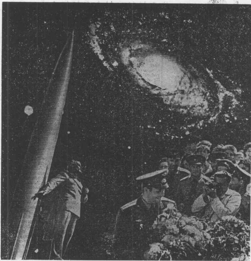
Фотоплакат Ю. ТУМАНОВА.

НАЗВАНИЕ ЭКСПЕРИМЕНТА — АНГЕЛ — звучит несколько экстравагантно, особенно, если учесть, что он в известной мере связан с проблемами неба и Вселенной. Но на самом деле все проще, как часто бывает в физике элементарных частиц. АНГЕЛ — это Антипротон-Гелий или, точнее, поглощение медленных антипротонов ядрами легких элементов — водорода, дейтерия, гелия-3 и гелия-4. Широкая программа таких экспериментов начата в 1981 году группой физиков, работающих в ОИЯИ, в тандем с рядом специалистов из институтов СССР, ГДР, ПНР, ЧССР, НРБ, СРР и научных центров Италии (в Турине, Риме, Павии). Программа рассчитана на пять-семь лет и будет выполняться на ускорителе ИФВЭ и ЦЕРН.