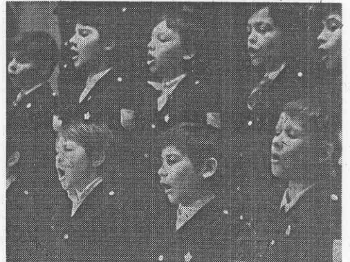
С большим желанием лют в хоре мальчиков ребята 1—6-х классов дубненских школ.