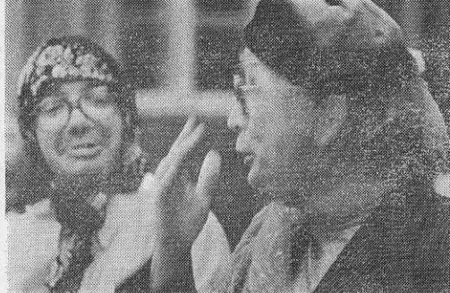
Из фотосерии «Физики шутят». КТО ЕСТЬ КТО! Фотозагадка Ю. ТУМАНОВА.