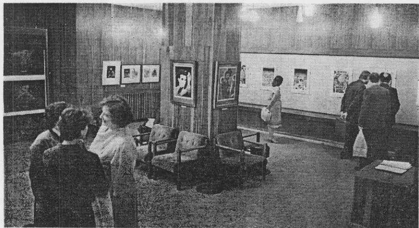
Почти каждый месяц в Доме культуры «Мир» можно увидеть новую выставку.