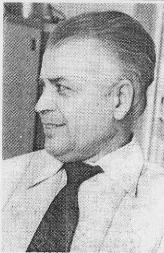
Он мудрецом не слыл И храбрцом не слыл, Но поклонись ему: Он человеком был.