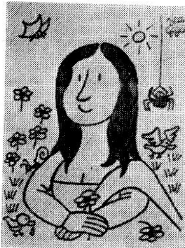
Так бы ее изобразил Ж. Эффель в представлении польского художника Э. Липинского.