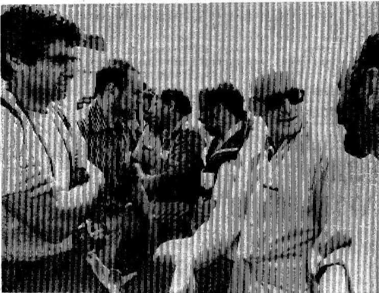
Непринужденный разговор на борту «Охотника» в предчувствии обеда.