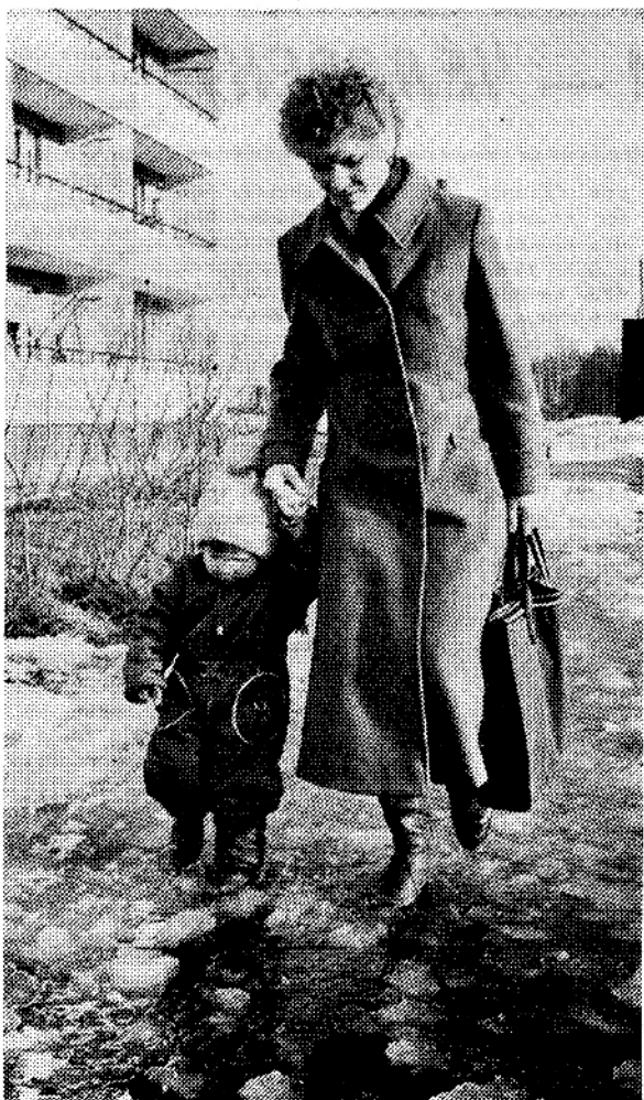
По весенним лужам.

Объединившись, мы стали более дееспособными, нам уже под силу дела масштабные. Ближайшая акция, в которой примем участие, — 1 независимый женский фо-