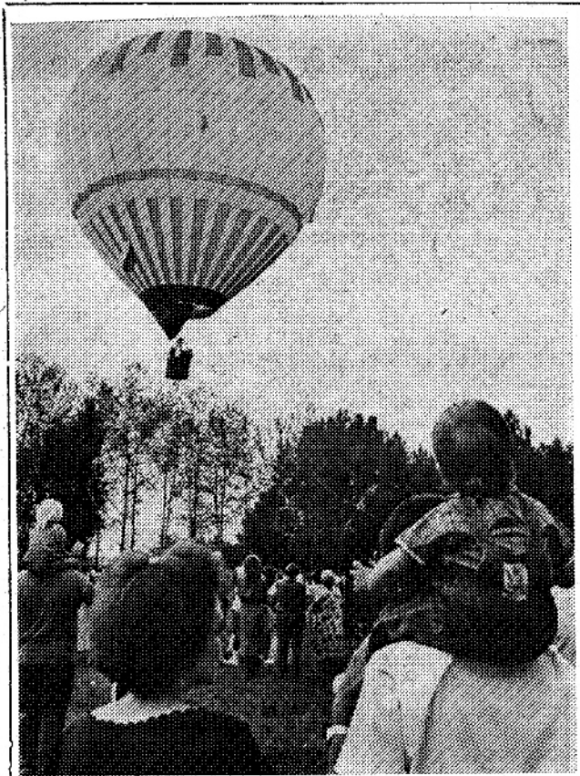
Будут ли праздники на Молодежной поляне?

Проблема ведь на самом деле гораздо шире, чем вопрос о том, отдать или не отдать 2 га земли на берегу Волги в парковой зоне. Институтский район города имеет свою специфику, свои потребности, свою историю. Мировой опыт развитых