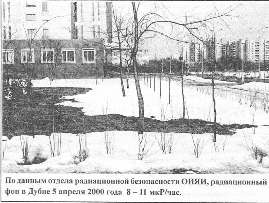
По данным отдела радиационной безопасности ОИЯИ, радиационный фон в Дубне 5 апреля 2000 года – 8 – 11 мкР/час.

БЕЗ ЕДИНОГО сброса мощности и срабатывания аварийной защиты прошел очередной цикл на реакторе ИБР-2, закончившийся в канун Дня рождения Института – 24 марта. Свои измерения наряду с сотрудниками ОИЯИ и российских центров провели исследователи Германии, Польши и Финляндии.