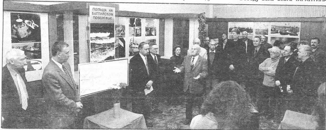
Одним из первых мероприятий, посвященных Дню основания ОИЯИ, стало открытие польской фотовыставки в Доме ученых.