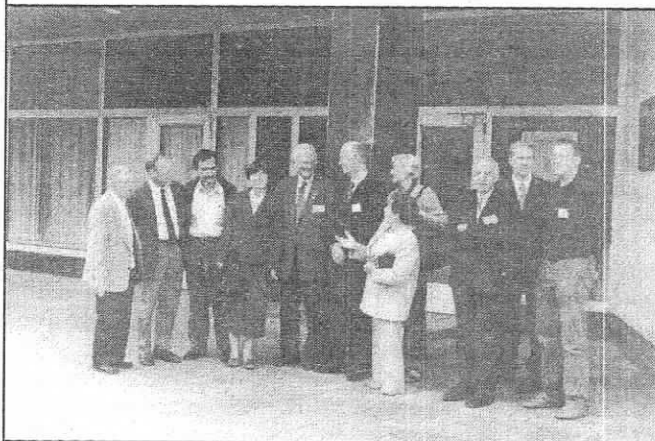
Самой представительной была делегация из Центра М. Дельбрюка (Берлин-Бух, Германия), в которой с 1925 по 1945 годы работал Н. В. Тимофеев-Ресовский.