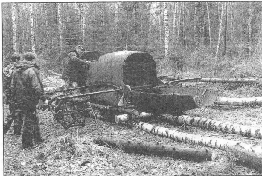
По данным отдела радиационной безопасности ОИЯИ, радиационный фон в Дубне 3 ноября 2004 года составляет 9–11 мкР/час.

ТАК НАЗЫВАЕТСЯ вторая экскурсия из цикла «История Москвы в