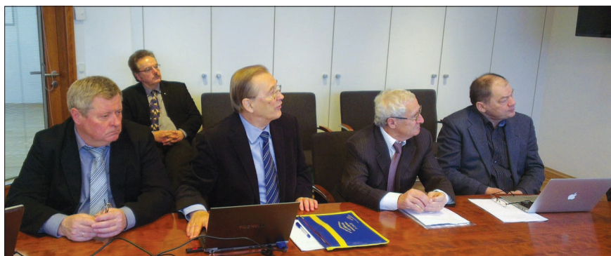
Делегация ОИЯИ на заседании Координационного комитета