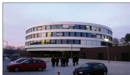
Центр исследований с лазерами на свободных электронах (CFEL DESY)

исследований на 2013 год, трехлетние итоги реализации Семи-летнего плана развития ОИЯИ, современные тенденции научной политики в области фундаментальных естественных наук в Германии и Европе. Стороны с удовлетворением отметили успешное развитие сотрудничества ученых ОИЯИ и Германии.