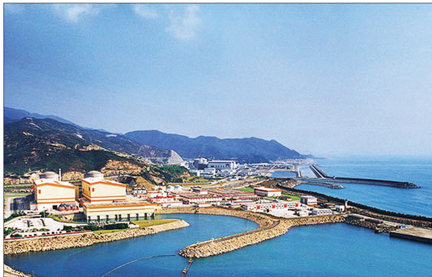
Вид на реакторный корпус Daya Bay

Точку в этом споре поставил эксперимент SNO (Канада), в котором вместо воды применили тяжелую воду D_2O . Казалось бы, что такого – вместо водорода дейтерий? Всего лишь еще один нейтрон, но разница оказалась огромна! Дело в том, что нейтрино может взаимодействовать с веществом двумя способами – с рождением заряженного лептона (электрона, мюона, тау-лептона) или же оставаясь нейтрино (нейтрино прилетело, провзаимодействовало, и оно же улетело). Первый способ называется заряженным током, а второй нейтральным током. Заряженный ток хорош тем, что в нем есть флэйворная метка нейтрино, а в нейтральном такой метки нет, поскольку все нейтрино одинаково охотно взаимодействуют по каналу нейтрального тока. Этот кажущийся недостаток для осцилляционных экспериментов, на самом деле, – отличная штука! Действительно, если солнечные электронные нейтрино из-за осцилляций превратились в смесь электронных, мюонных и тау-нейтрино, то вся эта смесь все равно будет одинаково взаимодействовать по каналу нейтрального тока, давая тем самым экспериментаторам возмож-