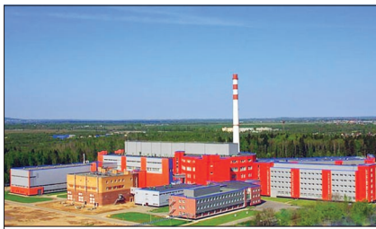
Реакторный комплекс ПИК.