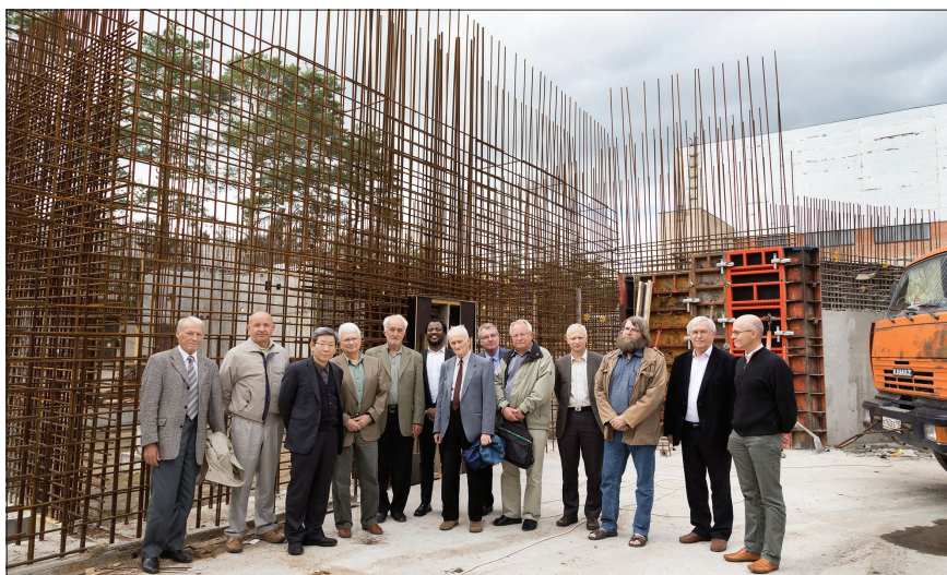
Члены ПКК по ядерной физике на строительной площадке нового корпуса ЛЯР.