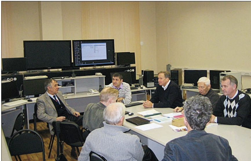
Фото 2. Пультавая Нуклотрона: обсуждение проекта ВЧ-станций барьерного напряжения коллайдера NICA.

Разработка концептуального проекта ускоряющей высокочастотной системы бустера была начата в 2009 году. ИЯФ имени Будкера предложил современное решение, в котором, в отличие от ускоряющей системы Нуклотрона, используется не резонатор «открытого типа», а широкополосный, на основе новых фер-