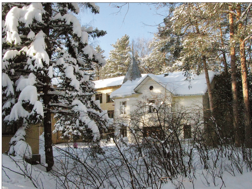
Как хочется белого снега...