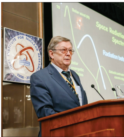
Как всегда интересным было выступление директора НИИЯФ МГУ М. И. Панасюка, посвященное различным радиационным опасностям для человека и электроники в космосе.

ральной нервной системы. Наблюдаются нарушения памяти, функции обучения, что озадачивает и беспокоит специалистов, занимающихся вопросами оценки радиационной опасности при межпланетных полетах. Я думаю, мы будем двигаться все более интенсивно в плане моделирования действия тяжелых заряженных частиц на строение и функции центральной нервной системы.