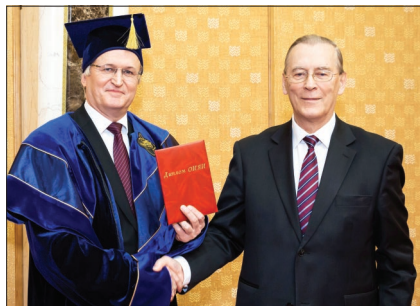
Вручение диплома «Почетный доктор ОИЯИ» академику И. Тигиняну (Молдова).

сающими возможностями. Для всех нас это было настоящее открытие. Блестящее свидетельство того, насколько высоко наши белорусские друзья ценят подлинную культуру, как много внимания уделяет республи-