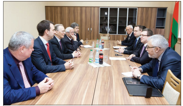
В Госкомитете по науке и технике.

рассмотрели уникальную, идею создать в Белоруссии совместный с Дубной и ЦЕРН центр, который мог бы оказать непосредственное содействие в выполнении программ развития и в ЦЕРН и Дубне, ис-