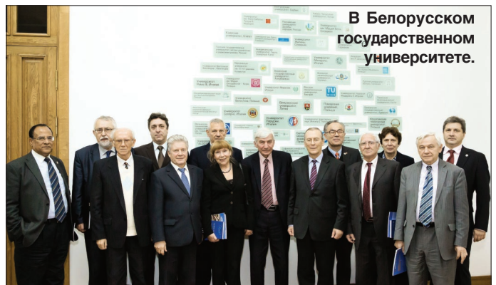
В Белорусском государственном университете.

Отдельных слов заслуживает культурная программа. Мы посетили Концертный зал «Минск», это совершенно уникальный дворец, с потря-