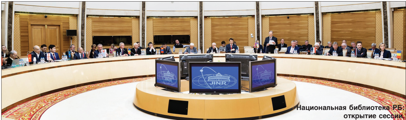
Национальная библиотека РБ: открытие сессии