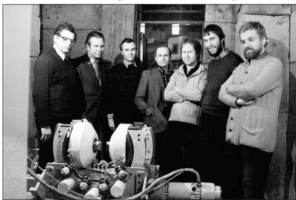
С коллегами из ГДР возле изготовленного в ГДР многоосевого гониометра с магнитом. Середина 1980-х годов.