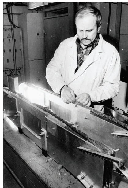
На спектрометре СПН-1, монтаж оборудования. Середина 1980-х годов.