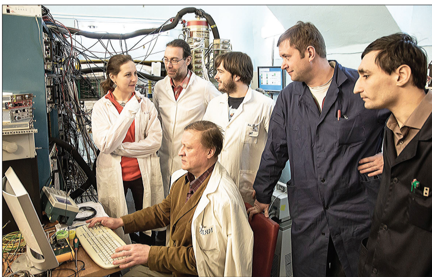
Группа физиков, которая разрабатывает сепаратор скоростей SHELS для разделения продуктов ядерных реакций.

В целом решение IUPAC является признанием выдающегося вклада ученых ОИЯИ в открытие «острова стабильности» сверхтяжелых элементов, что является одним из важнейших достижений современной ядерной физики.