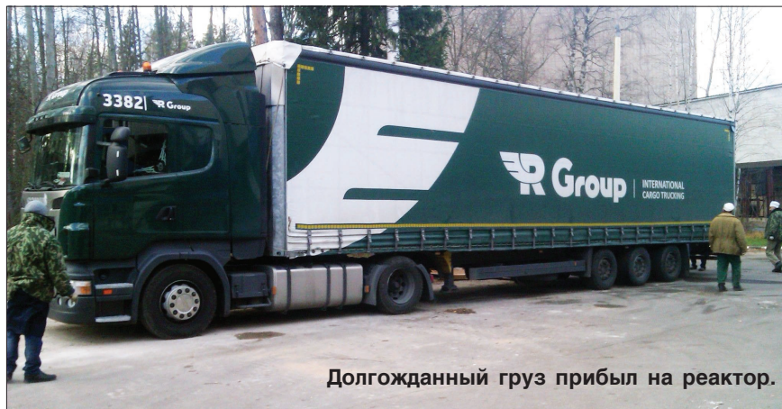
Долгожданный груз прибыл на реактор.