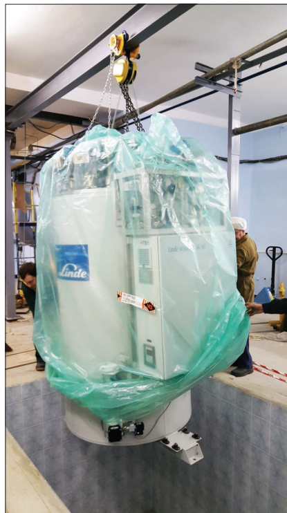
Установка блока охлаждения на штатное место – непростая задача.

Мощность криогенной установки Linde составит 1200 Вт при 10 К. Рефрижератор Linde был спроектирован специально по индивидуальному проекту ЛНФ, с учетом необходимых режимов работы комплекса. Рефрижераторы и ожижители Linde AG отвечают всем мировым стандартам и требованиям качества и используются на передовых международных исследовательских площадках в ЦЕРН, Институте Пауля Шеррера (Швейцария), Юлихе (Германия), Окридже (США), в NASA и других центрах. До настоящего времени в России подобную установку имел только Петербургский институт ядерной физики в Гатчине.