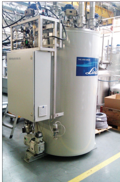
Блок охлаждения гелия КГУ 1200/10 на заводе в Швейцарии.

Работы по холодному замедлителю были приостановлены в феврале 2015 года для того, чтобы подготовить помещение для новой криогенной установки, которую мы приобрели в Швейцарии. Эта установка будет обеспечивать холодом систему из