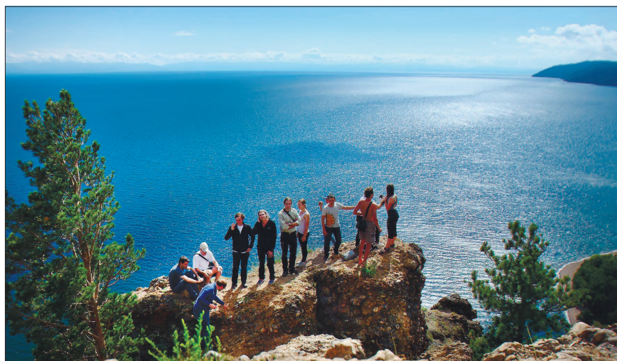
Участники школы на скале Скрипер

Игорь ИВАНОВ, фото Антона ПОЛУЭКТОВА, Инны НИЗАМИЕВОЙ