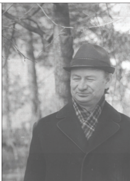
Григорий Григорьевич Баша.