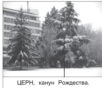
ЦЕРН, канун Рождества.

Мое личное впечатление состоит в том, что ОИЯИ и ЦЕРН, имея большой опыт совместных работ, вступили в такую фазу сотрудниче-