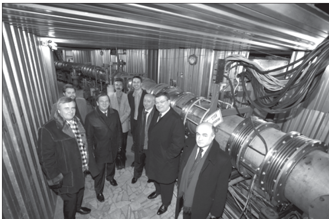
Государственная делегация Республики Украина в ЛФВЭ на нуклотроне. Посол – второй справа.