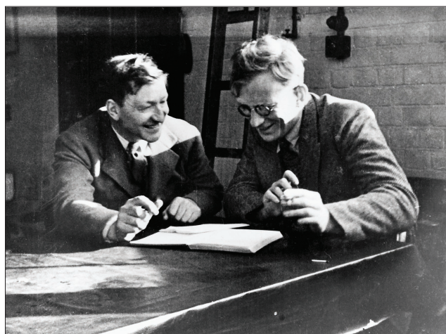
Джон Кокрофт и Георгий Гамов демонстрируют корреспонденту британской газеты пример плодотворного международного сотрудничества в ядерной физике. 1931 год.

Его заметил Бор, он снискал расположение Резерфорда — особенно после того, как показал мэтру, как его экспериментальные точки, «твердые факты природы», ложатся на его теоретическую кривую. Бор выхлопотал ему стипендию, и он задержался в Европе еще на год и