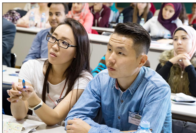
Участники практики из Монголии на обзорной лекции.

Итоги участия студентов из Египта коротко подвел Ваел Бадави : В этом году в Египте пришлось отбирать 30 участников практики из 350 (!) претендентов. Если в 2009 году мы принимали всех желающих, то сейчас, когда почти весь Египет узнал об этой практике, были специально организованы 10 комиссий, занимавшихся стро-