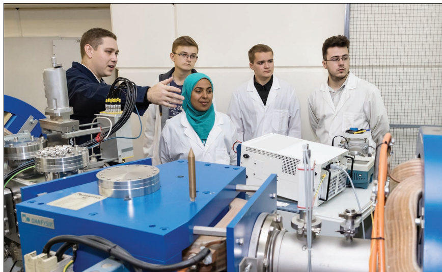
В ЛЯР студенты выбрали четыре исследовательских проекта.