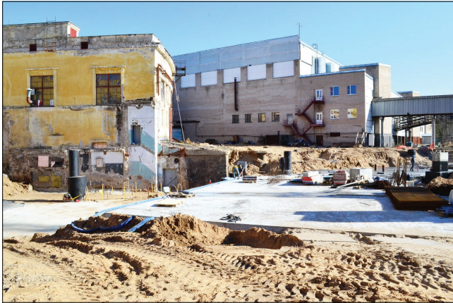
На стыке зданий установлены новые дренажные колодцы.