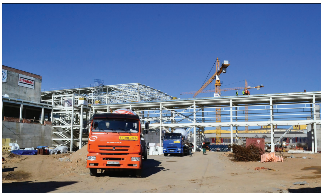
Пешеходный переход для обслуживающего персонала с одной стороны кольца на другую, которого не было в проекте 2013 года.

На площадке мы каждый раз вспоминаем, как изменился ландшафт с момента последнего посещения. Котлованные, земляные работы, траншеи, трубопроводы, дренаж – тогда часто упоминали понятие «пятно застройки», машину оставляли за забором, шли пешком. Пряжки, бетон, фундамент, дороги – стали обозначаться контуры павильона MPD и кольца коллайдера, появилась строительная дорога. Возведен туннель и здания – системы электронного охлаждения и детекторов, бетонные стены стали обрастать металлоконструкциями. Сейчас это уже лабиринт с новыми переходами, галереями. Металлоконструкции стали покрываться кровлей, вот-вот выйдут на объект монтажники фасадов. Пройдет не так много времени, и работы переместятся внутрь помещений.