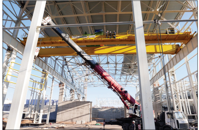
Монтаж крана для сборки детектора MPD.

«Штрабаг», заканчивая работы на каком-то участке, после этого тщательно убирает территорию от строительного мусора, ненужных конструкций. Посмотрите, стройка в разгаре, а на площадке приятно находиться.