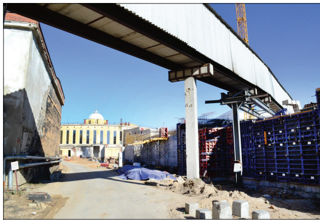
Одна из причин повторного прохождения экспертизы – кабельная эстакада, которая по проекту 2013 года должна была быть демонтирована.

– Основная трудность в том, что оборудование самого коллайдера не типовое. Его и до сих пор окончательно не разработали. Пока делали проект в общем, было все понятно. А