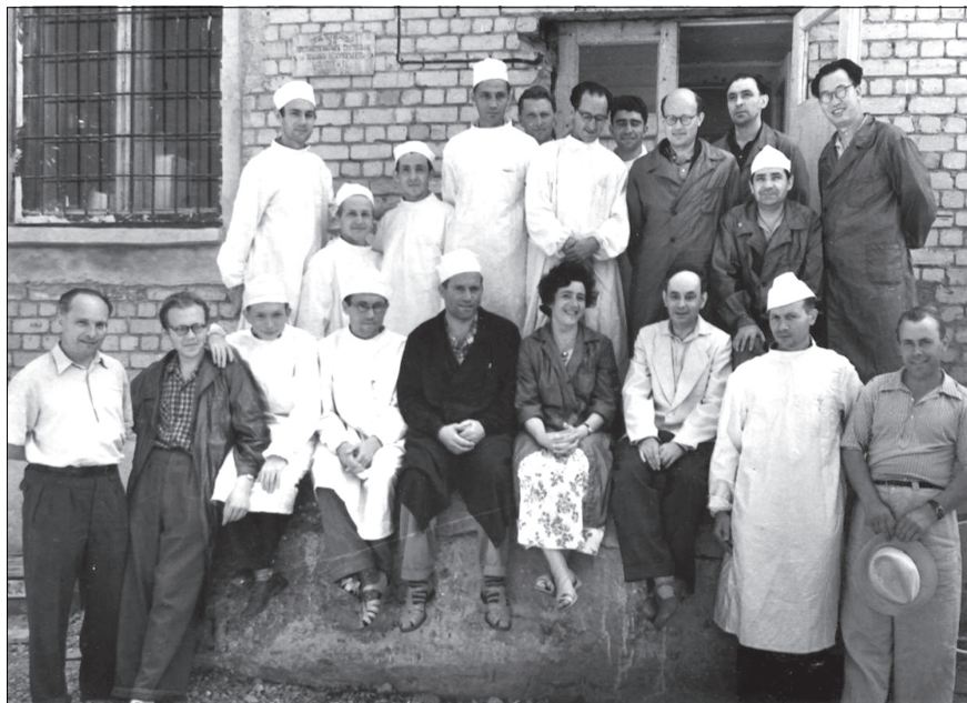
Июль 1959 года. У здания № 45.

ре и величина критической массы плутония. Когда я впервые пришел на критический стенд ИБРа, меня удивила система перемещения стального сектора с урановым вкладышем, имитирующим «подвижную зону», удивила какой-то доморощенностью, самодеятельностью. Сектор приводился в движение из соседней комнаты вручную, а вращение рукоятки передавалось к сектору длинными стальными тросами через систему блоков. Такая конструкция казалась мне тогда чрезвычайно наивной и несовершенной. Однако с позиции более опытного физика она была вполне оправдана и надежна. Многие в оборудовании этого стенда было сделано на скорую руку, но эта обнинская «рука» оказалась умелой.