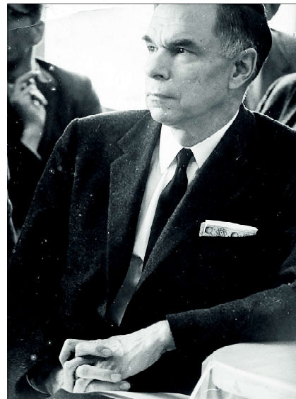
Г. Сиборг в Дубне. 28 мая 1963 года.

К тому времени... Так как все-таки речь и о людях, то должен я с горечью признать, что в Лаборатории ядерных реакций сложилась какая-то странная ситуация, мне до сих пор непонятная. Нашей небольшой группе, которая фактически состояла из четырех человек, вдруг перестали давать время на ускорителе. Почему, я не знаю. Может быть, потому что мы решили попробовать 105-й элемент синтезировать. Нам даже дали возможность сделать два облучения. В первом облучении мы обнаружили два случая, во втором – ноль. И все, больше возможности у нас не было. А это конец 1965 года. Представляете?