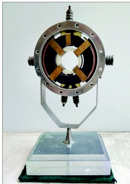
Часть устройства для синтеза трансурановых элементов, с помощью которого на внутреннем пучке У-300 были получены 102-й и 103-й элементы.