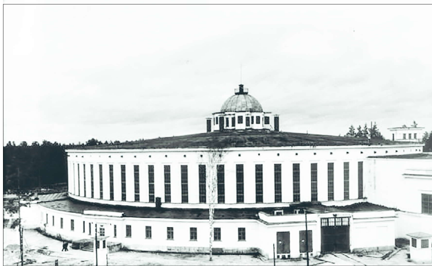
Здание синхрофазотрона, 1956 год.

– демонстрация фильма «Властелины кольца. История создания синхрофазотрона».