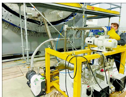
Испытания и наладка вакуумной системы соленоида.

– Результаты испытаний показали, что вакуумный объем и установленные на торцах фланцы герметичны. Также тест на утечку успешно прошел и гелиевый контур. Однако азотный контур испытания не прошел,