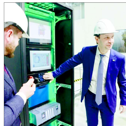
Старт испытаний на герметичность дает директор ОИЯИ Г. В. Трубников.

Испытана и адаптирована под испытания вакуумная система соленоида. Сектором инженерной поддержки MPD разработана программа автоматического управления вакуумной системой, предотвращающей выход из строя оборудования или разгерметизацию соленоида в процессе испытаний.