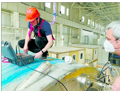
Проверка целостности сверхпроводящих кабелей обмотки соленоида.