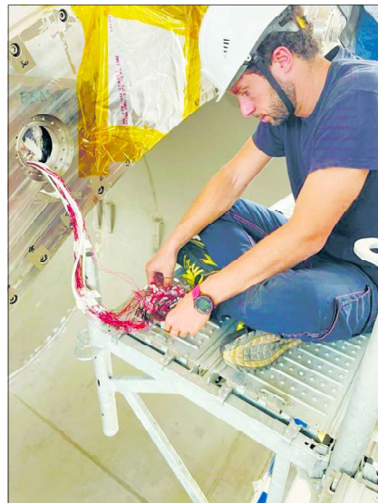
Замена вышедшего из строя разъема.

формы для криогенного оборудования). После сборки будут проводиться работы по измерению положения всей конструкции (магнитопровод + соленоид) для итогового определения отклонений.