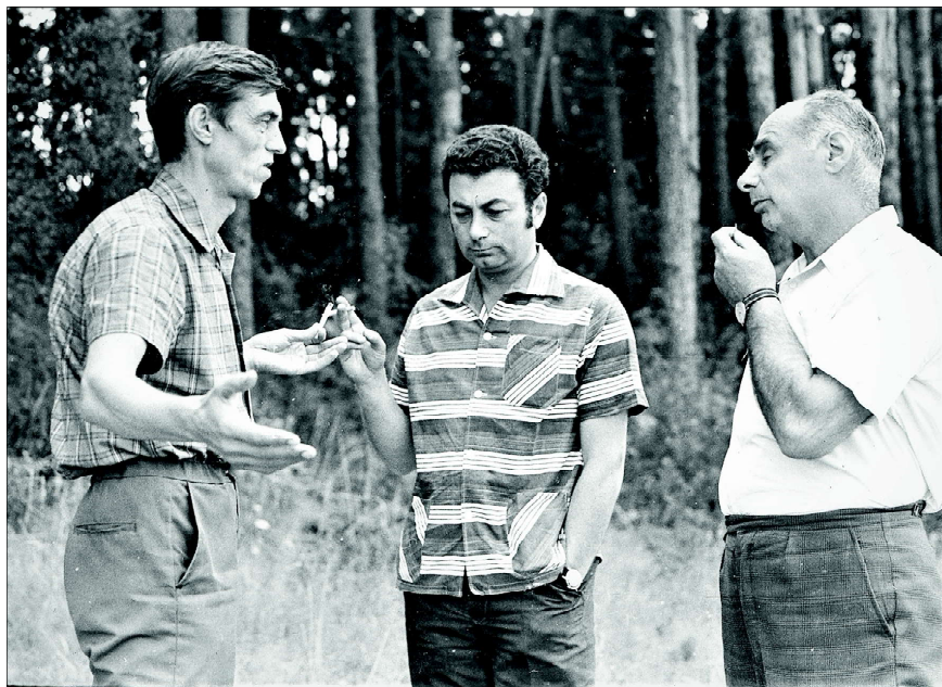
В. А. Друин, Ю. Ц. Оганесян, Г. Н. Флеров. Георгий Николаевич не был кабинетным ученым, он любил прогулки на свежем воздухе, во время которых можно поразмышлять вслух.