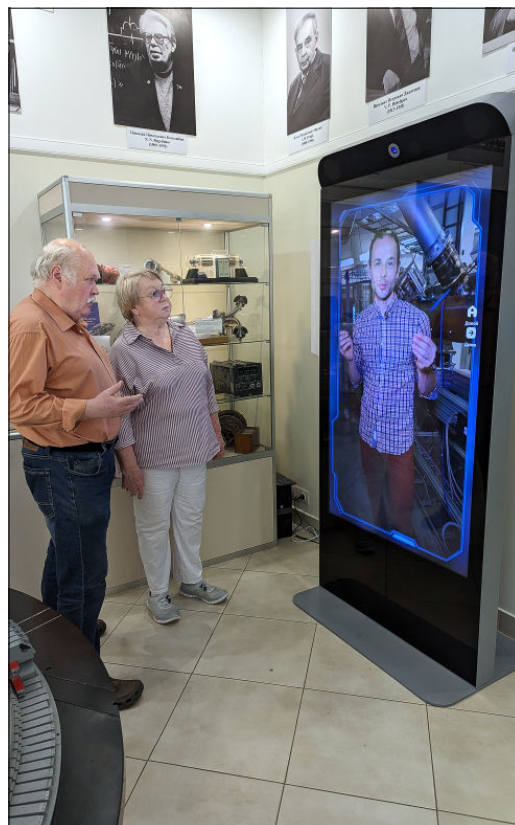
Инфогид в Музее ОИЯИ

Сейчас Инфогид ОИЯИ размещен в двух ключевых точках, открытых для посещения, — в Музее истории науки