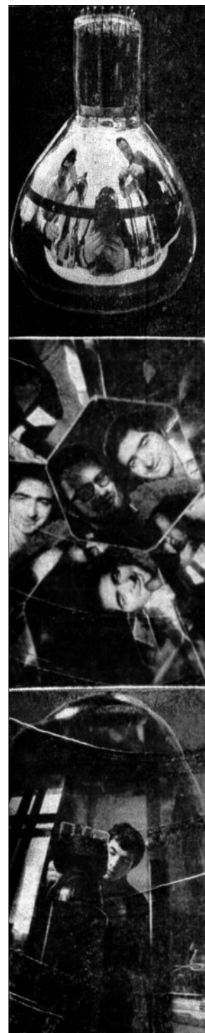
Фотомонтаж, выполненный Ю. Тумановым, отражает момент сборки спектрометров, их основные элементы и радостное настроение физиков

Сотрудники сектора надеются, что установка «Фотон» после своего завершения позволит получить ряд интересных физических результатов.