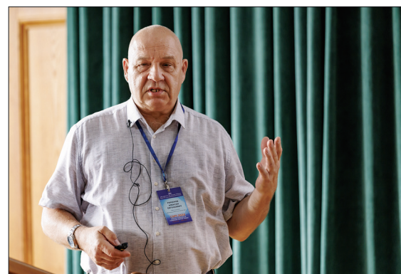
Профессор Алексей Евгеньевич Романов (Санкт-Петербург) демонстрирует зоопарк дисциплин

Исследование двумерных материалов до сих пор остается актуальным направлением. Так, на конференции был представлен доклад профессора Леонида Александровича Чернозатонского (Москва), в котором он показал принципиальную возможность существования новых алмазоподобных нитридных двумерных слоистых структур – нитриданов. Последние, кроме того, что имеют эстетичную муаровую структуру, обладают уникальными электронными и оптическими свойствами.