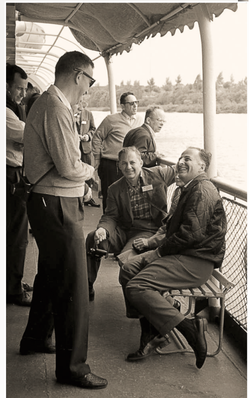
Участники Рочестерской конференции на экскурсии по Московскому морю.

В воскресенье, 9 августа, на конференции был перерыв. Делегаты совершили прогулку на теплоходе по Волге и Московскому морю. Многие из участников этой поездки — впервые в СССР. Но даже и для тех, кто уже бывали в нашей стране, было очень интересно побывать на великой русской реке.