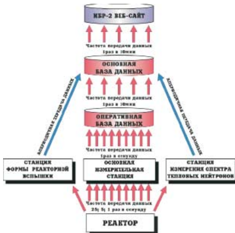
Рис. 2. Схема передачи данных в режиме реального времени (on-line) на веб-сайт ИБР-2, полученных в ходе реакторного цикла

Наибольший интерес представляет аналитическая часть по мониторингу состояния ИБР-2 «Analysis of Cycles Statistics». Здесь выполнен сравнительный анализ основных параметров циклов и параметров нейтронных каналов за период с ноября 1996 г. по май 2000 г. Из основных параметров для анализа были выбраны «Full Time», «MR Operation Time», «On Power Operation Time», «Time for Experiment», «Energy Produce», «Average Value of Power», «Number of Shutdowns», «Average Plutonium Burn-Up», «Maximum Plutonium Burn-Up».