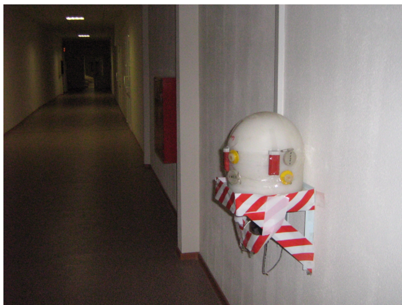
Рис. 2. Расположение дозиметров в точке 2 (датчик 3 АСРК) на комбинированном замедлителе