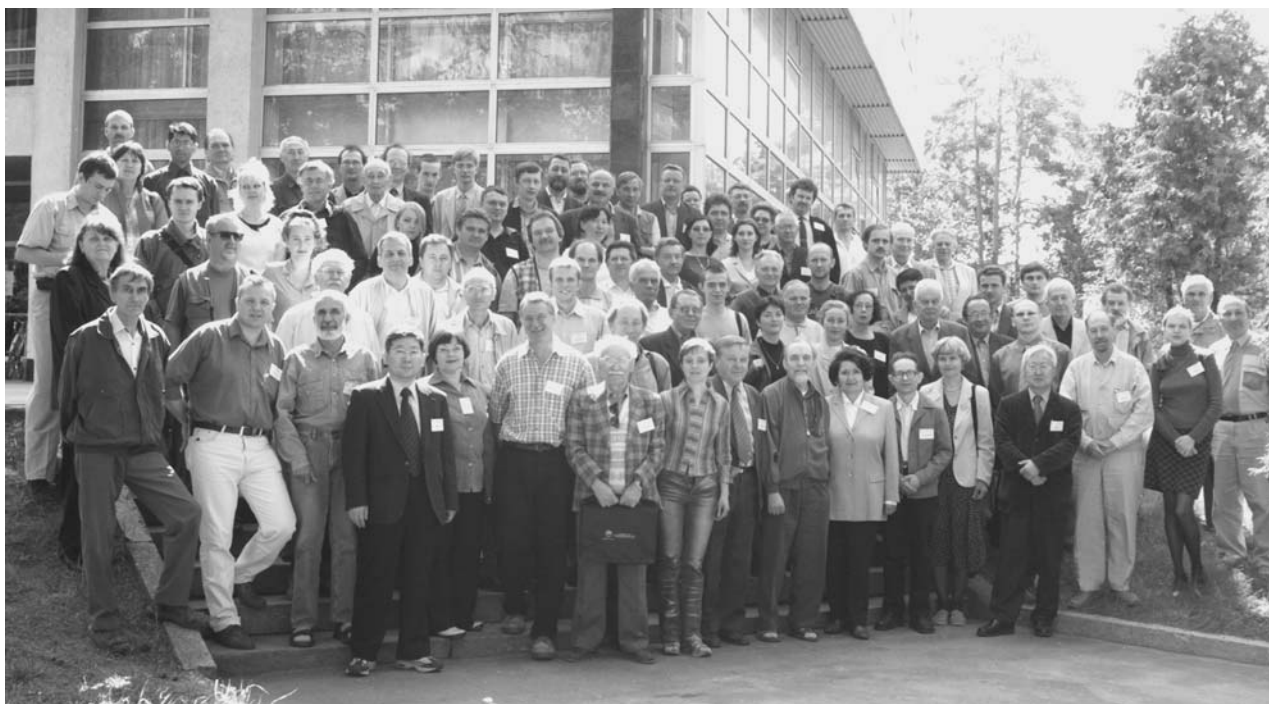
Дубна, 28–31 мая. Международный семинар по взаимодействию нейтронов с ядрами (ISINN-11)