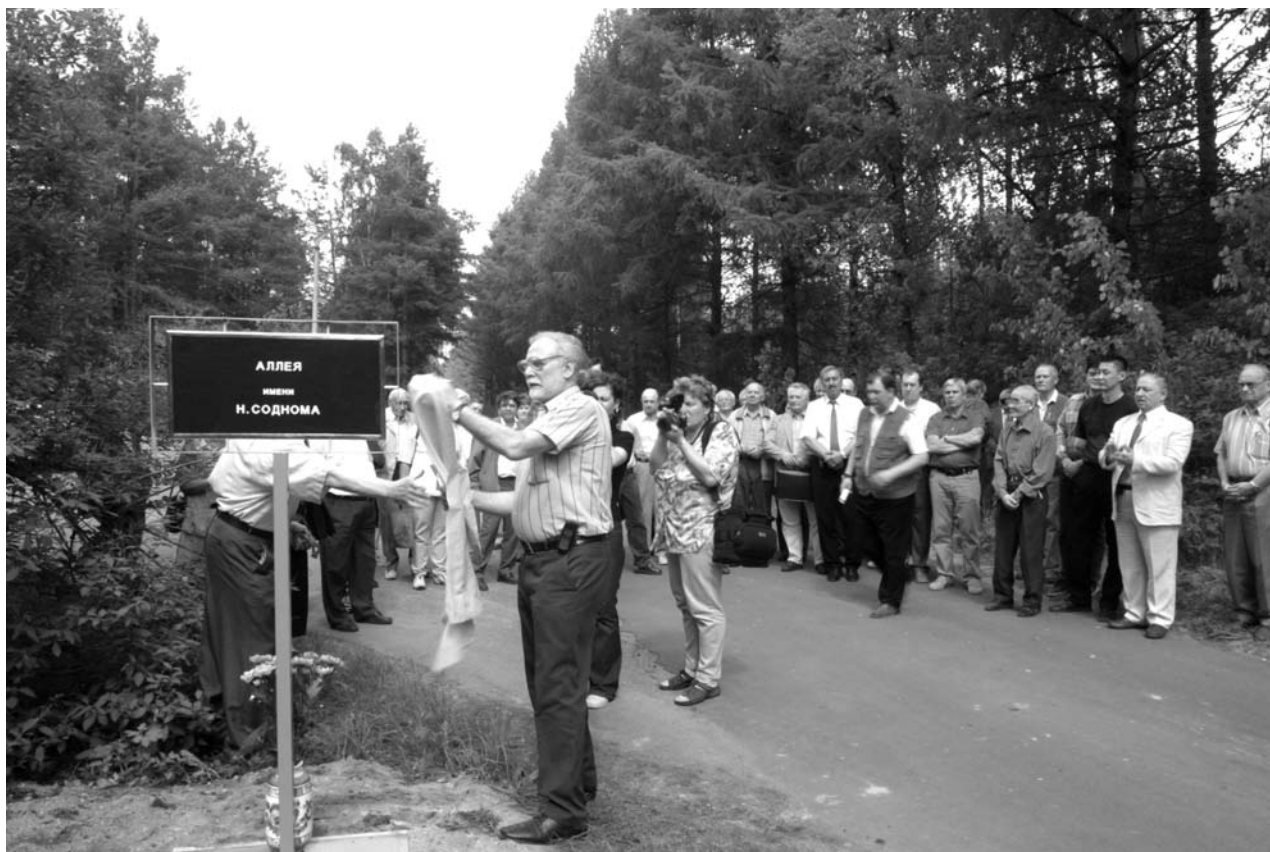
Дубна, 23 мая. Открытие аллеи имени академика Н. Соднома (Монголия) на территории Лаборатории нейтронной физики им. И. М. Франка