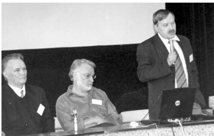
Дубна, 8–13 сентября. 10-я Международная конференция по ионным источникам «ICIS-2003»