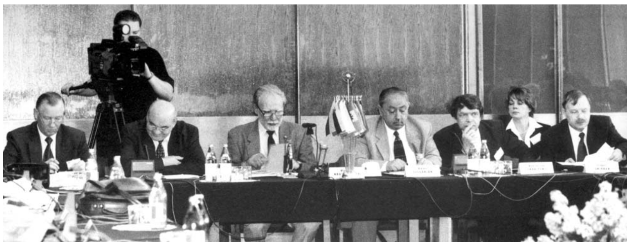
Дубна, 5–6 июня. 94-я сессия Ученого совета ОИЯИ