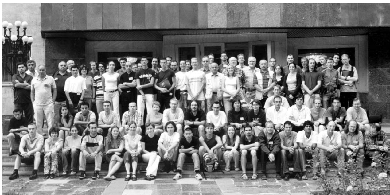
Цахкадзор (Армения), 24 августа – 6 сентября. Участники XI Европейской школы по физике высоких энергий