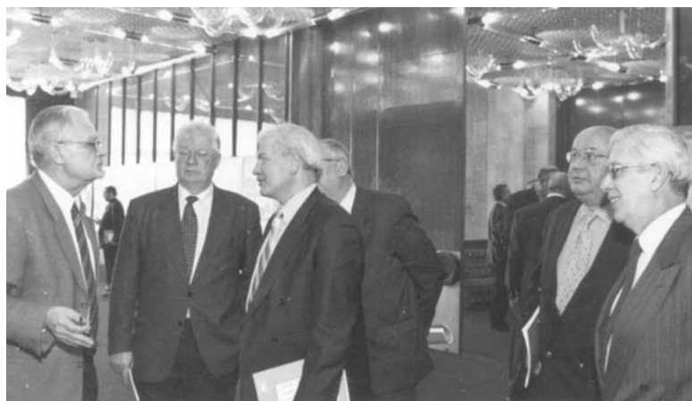
Дубна, 6 марта. Визит в ОИЯИ делегации Высших дипломатических курсов Министерства иностранных дел РФ