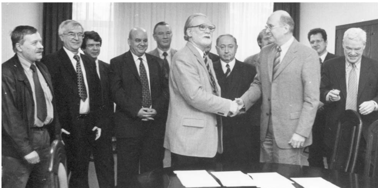
Дубна, 22 января. Подписание Соглашения о научно-техническом сотрудничестве между ВМВФ (Германия) и ОИЯИ на очередной трехлетний период