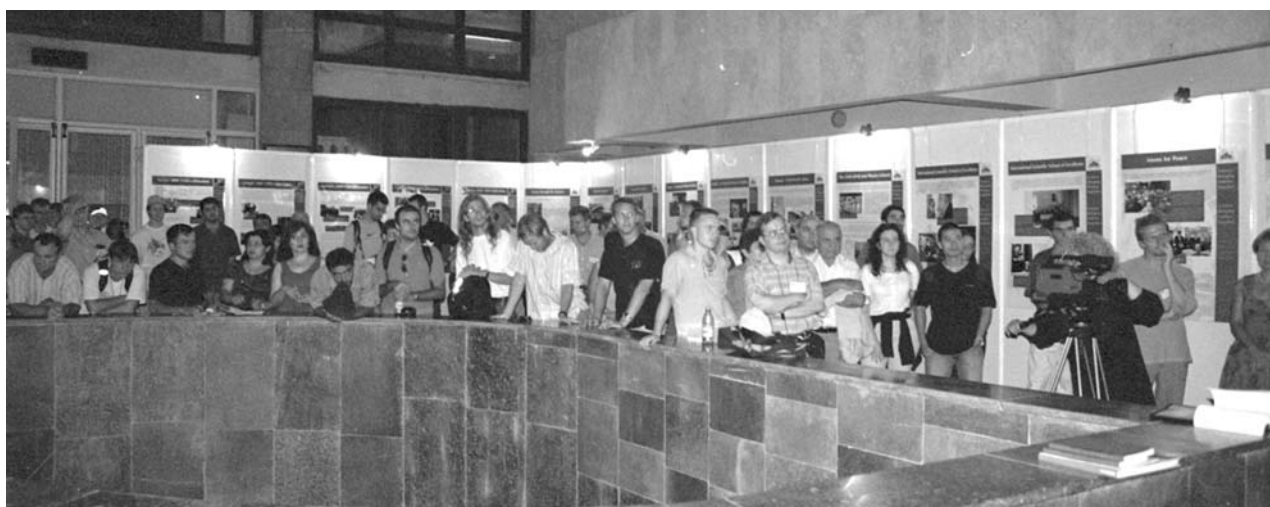
Ереван, 27 августа. XI Европейская школа по физике высоких энергий. Церемония открытия совместной выставки ОИЯИ-ЦЕРН «Наука сближает народы»