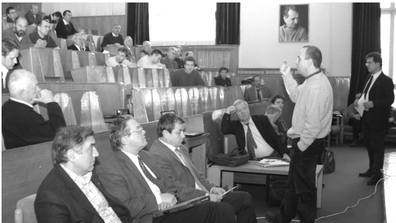
Дубна, 20 ноября. Международное рабочее совещание ОИЯИ–GSI (Германия) по программе экспериментов на новом ускорительном комплексе тяжелых ионов и антипротонов в Дармштадте