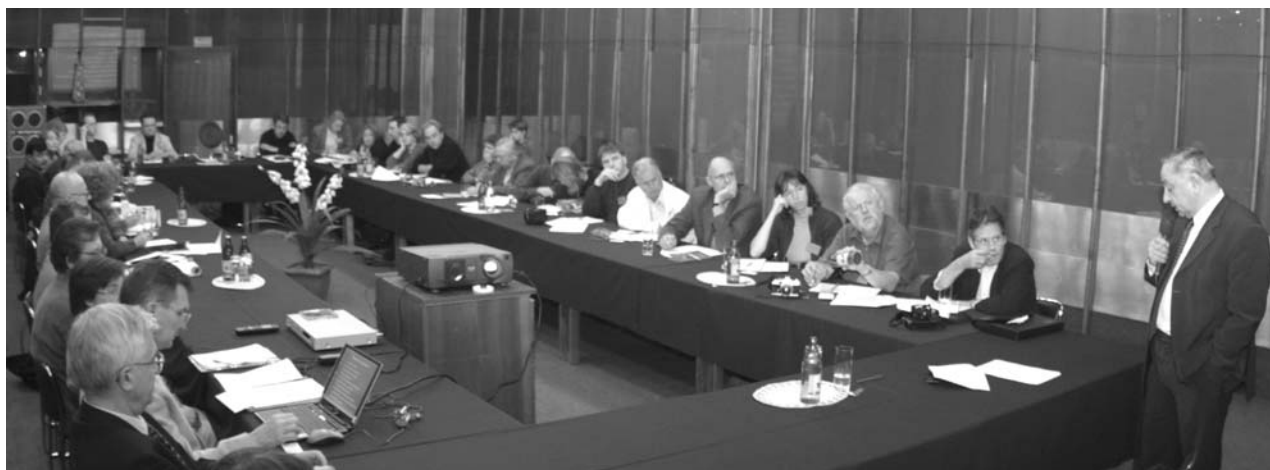
Дубна, 26 сентября. Выездное заседание Европейского союза ассоциации научных журналистов (EUSJA) в ОИЯИ