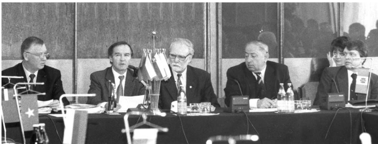
Дубна, 20–21 марта. Очередная сессия Комитета полномочных представителей государств — членов ОИЯИ