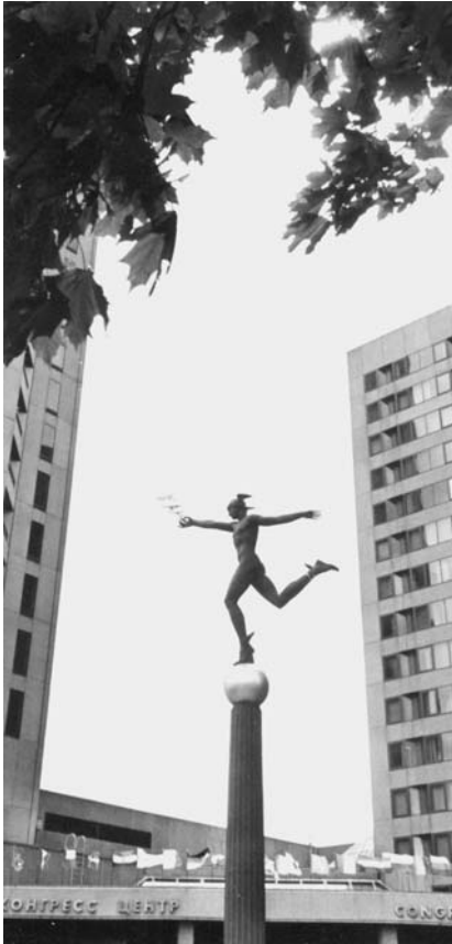
Москва, 17–21 июня. VIII Международная конференция по ядерной физике «Ядро-ядерные столкновения»