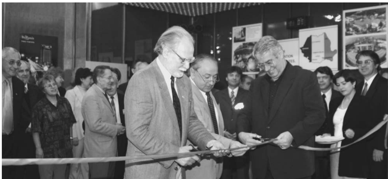
Дубна, 6 июня. Заседание круглого стола «Румыния в ОИЯИ». Открытие выставки