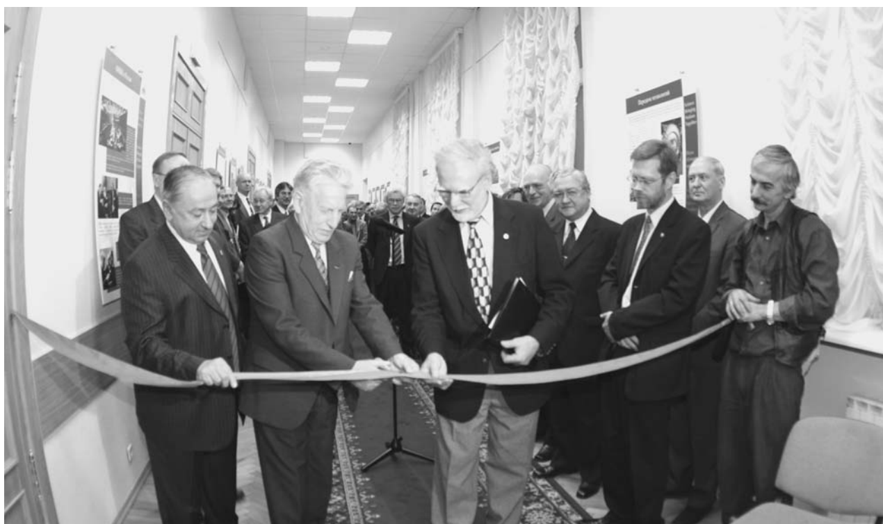
Москва, 30 октября. Торжественное открытие выставки ОИЯИ–ЦЕРН «Наука сближает народы» в Дипломатической академии МИД РФ