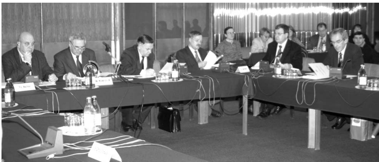
Дубна, 20 ноября. Заседание Программно-консультативного комитета по физике конденсированных сред